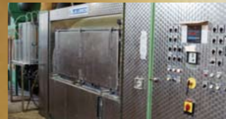
Waschanlage für Federn und Daunen