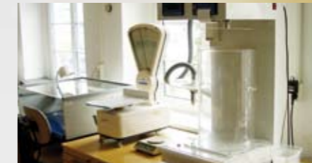
Einblick in das Labor