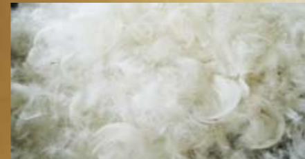
Rohfedern und Daunen