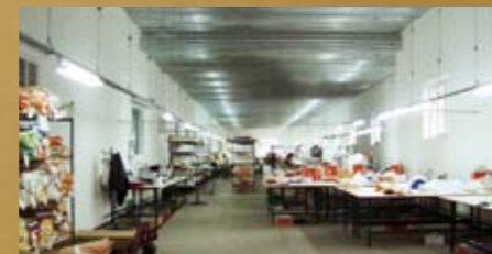
Einblick in die Produktion