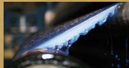
Nach dem Waschvorgang erfolgt das Färben