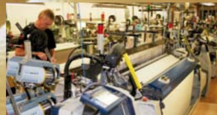
Ein Webautomat wird eingerichtet